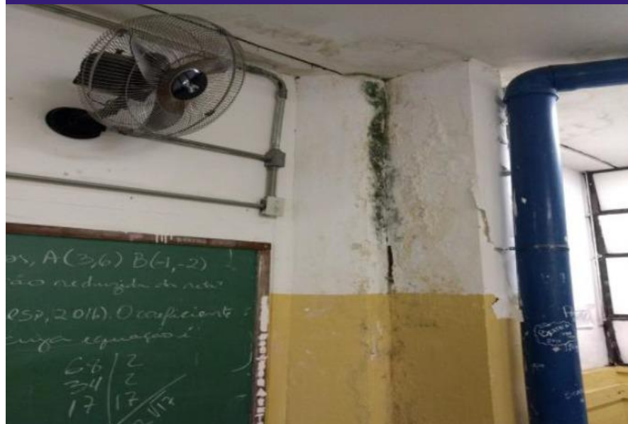
Reforma estrutural do telhado