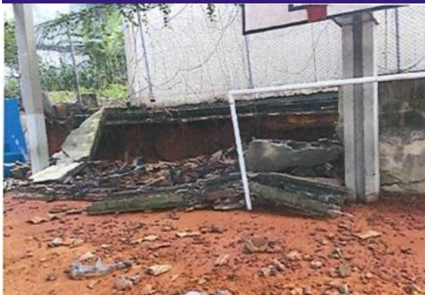
Conserto do muro